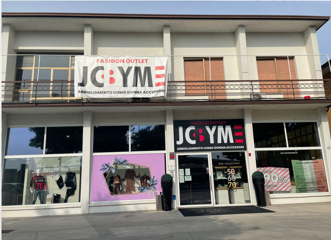
foto vetrina settembre 2021