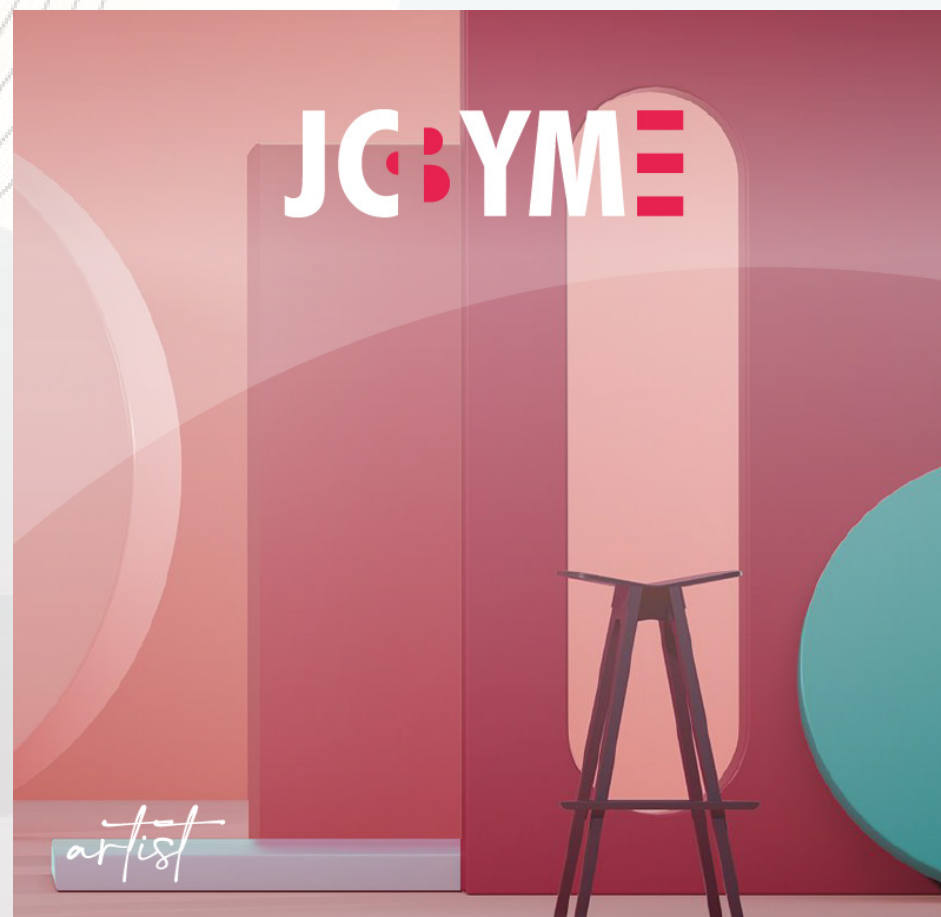
esempio di allestimento

L'azienda si riserva il diritto di scelta